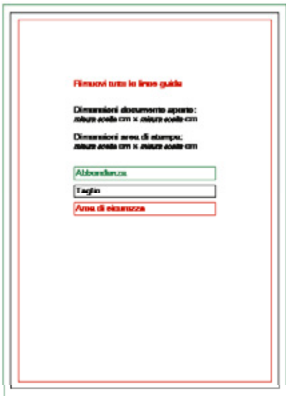
Esempio di template scaricabile